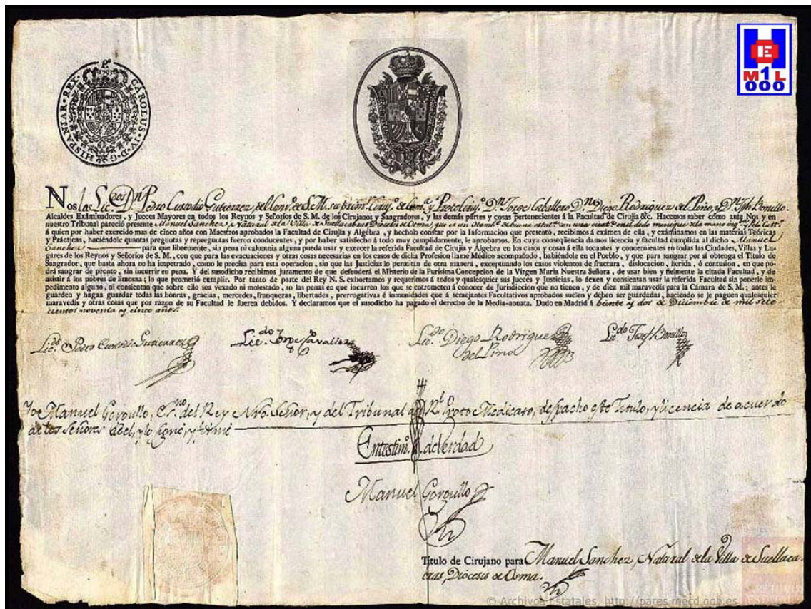
Foto 4 Título oficial de sangrador expedido en 1795

El Hospital de Antezana es vecino de la Casa de Cervantes, y su visita se puede encadenar con la casa del insigne escritor dentro de un paseo por la calle Mayor, donde estaba el barrio judío medieval. Precisamente, el Hospital de Antezana está enfrente del actual pasadizo a lo que era la Sinagoga Mayor.