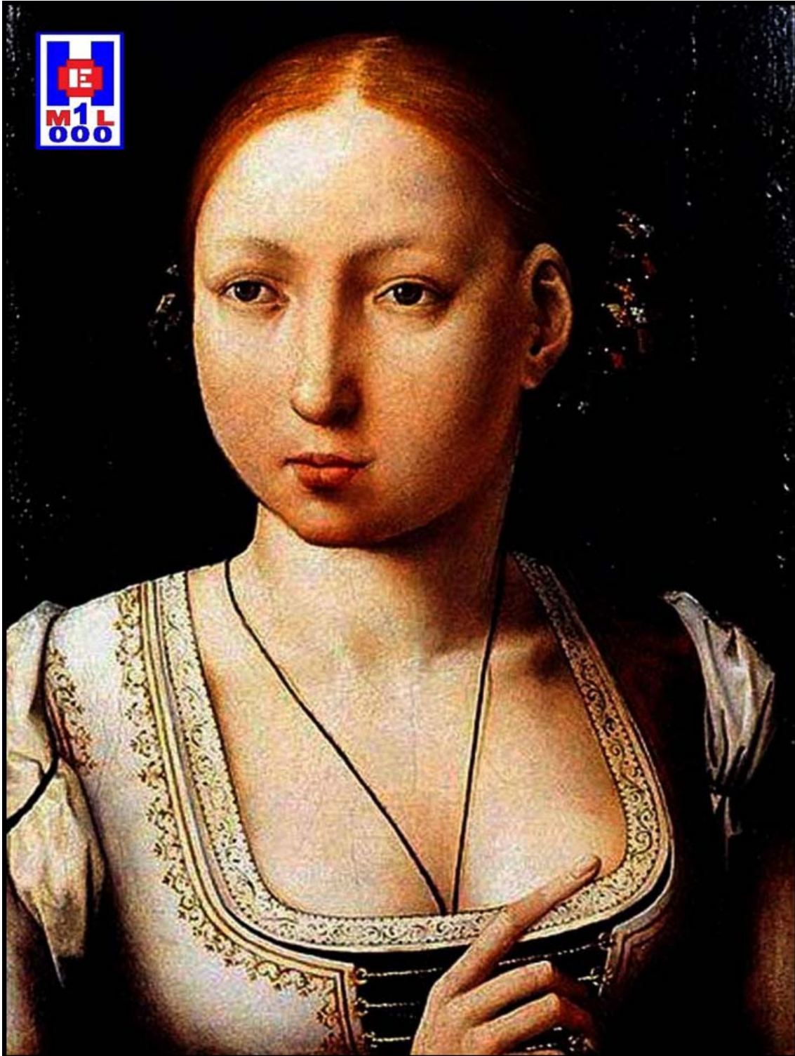
Foto 3 Mujer de la época sobre el año 1500