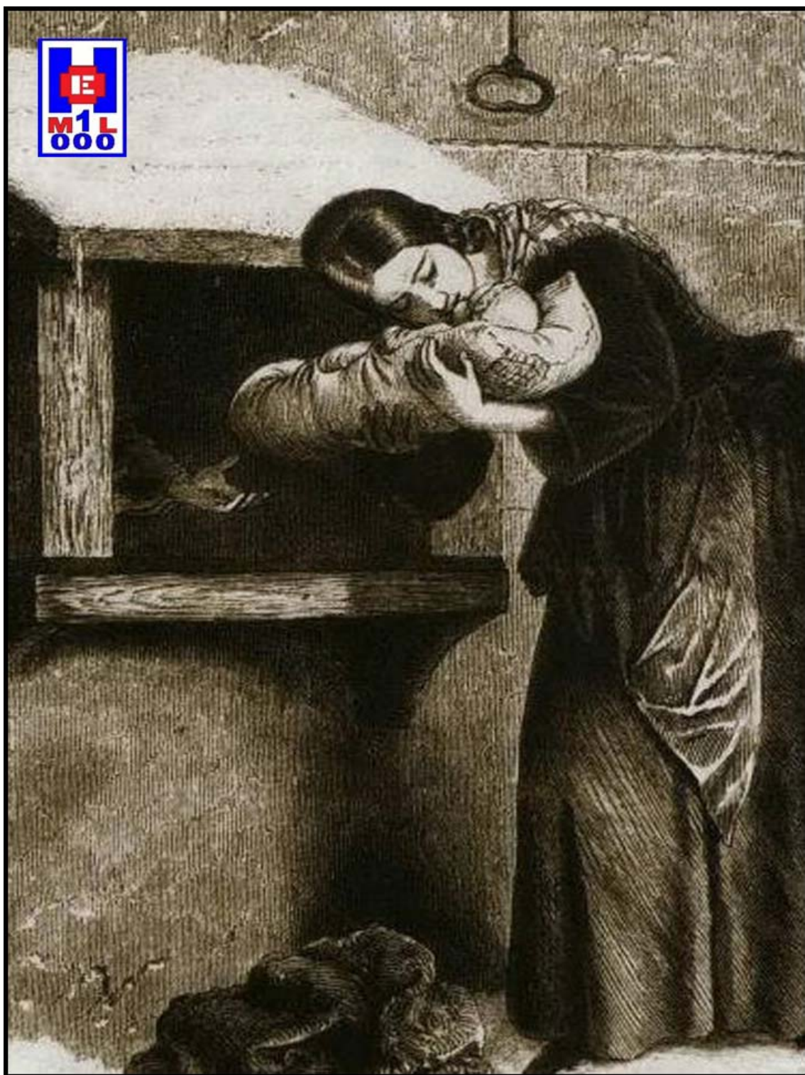
Foto 1 La chica con el bebe en la cocina de Jean Baptiste Chardin