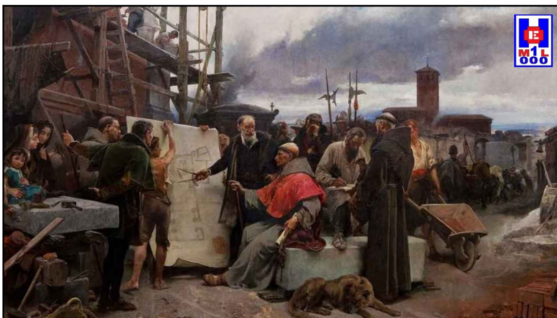
Foto 7 Francisco Jiménez de Cisneros, representado como fundador del Hospital de la Caridad de Illescas en 1510 e inmortalizado en una pintura por Alejandro Ferrant, 1892

Del conjunto de obras de arte que se sitúan en el templo, destaca la talla de Nuestra Señora de la Misericordia , obra con toda probabilidad del taller de Martínez Montañés (siglo XVII). Está policromada de manera magistral, hasta el punto de no haber sufrido prácticamente retoques en los casi cuatro siglos que han pasado por ella (2).