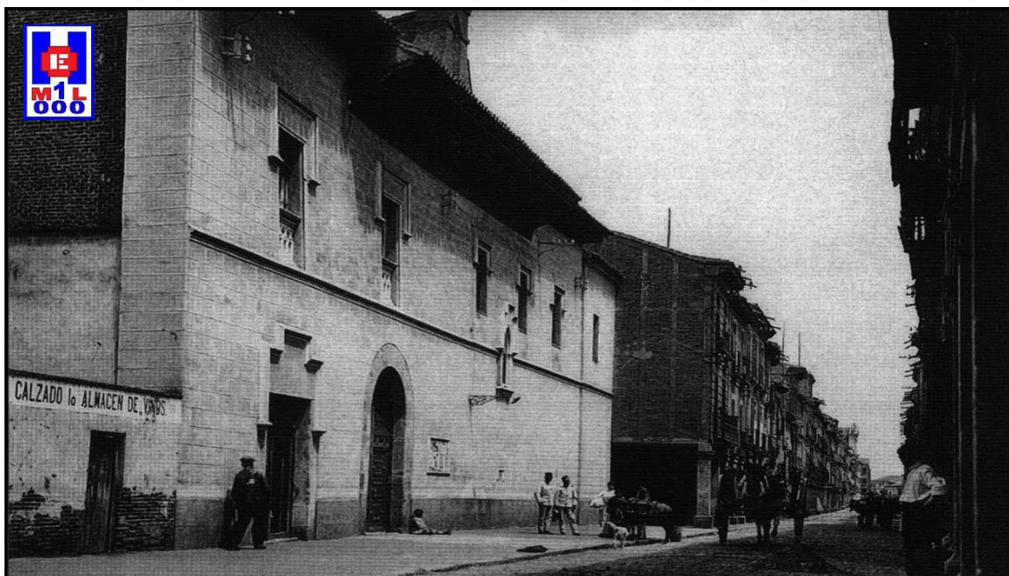
Foto 2 Hospital de Antezana en Alcalá de Henares

Además, se le facilitaban clases para aprender a leer y a escribir, algo poco común en aquella época. Hay registros documentales en los que queda constancia de que no sabía firmar, aunque en otros posteriores ya aparece su firma, lo que confirma el cuidado con que se trató siempre a los empleados del Hospital de Antezana, tuvieran el puesto que tuvieran (1).