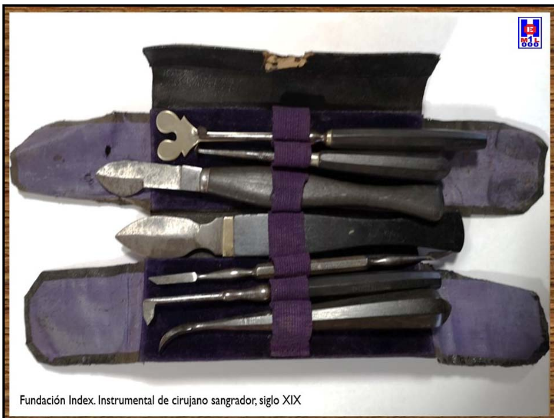
Foto 6 Instrumental de cirujano sangrador del siglo XIX.

En el Museo Casa Natal de Cervantes en Alcalá de Henares (domicilio en consecuencia del matrimonio Rodrigo Cervantes – Leonor de Cortinas) se exhibe la “botica o cámara de Rodrigo de Cervantes”. Tratándose de un Zurujo, que fundamentalmente practicaba sangrías para extraer los malos humores, se observa en su casa un sillón adecuado para llevarlas a cabo y, por supuesto, lancetas y bacías. Se ven, igualmente, botes de farmacia de Talavera, orzas, cajas para píldoras y almireces. Con ello se hace referencia a que médicos y zurujanos de aquella época, en muchas ocasiones, elaboraban sus propios fármacos. La medicina de tradición galénica que se practicaba entonces consideraba que la enfermedad se asociaba al desequilibrio de los cuatro humores (bilis negra, bilis, flema y sangre) y para restablecer el equilibrio se recurría a los purgantes, lavativas y sangrías. Las sangrías eran incisiones que se hacían en varias partes del cuerpo, pero los purgantes y otros medios eran preparados por el mismo zurujo.