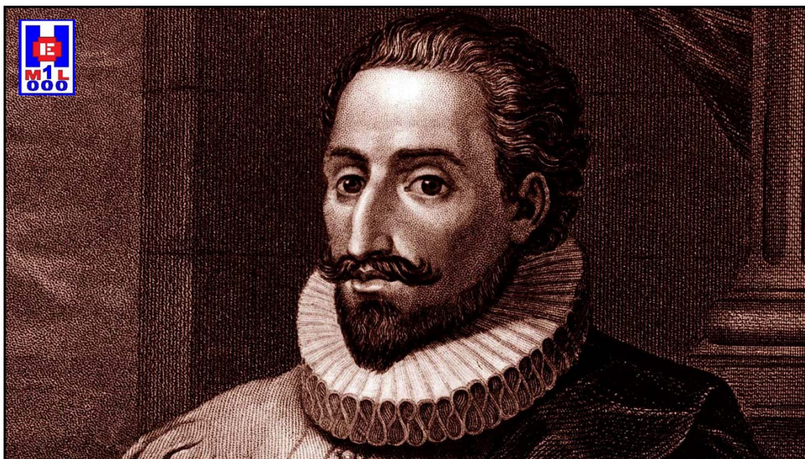
Foto 5 Retrato de Miguel de Cervantes Saavedra

El edificio del Hospital de Antezana de Alcalá de Henares, junto con la Casa natal de Cervantes , es el único tramo donde no hay soportales de la calle Mayor, pues lo que había, en medio de la fachada del Hospitalillo , sobre la puerta, era un amplio balcón bajo un alero de estilo mudéjar, muy apreciado por los expertos. El alero todavía se puede ver, no así el balcón, que desapareció en 1800, cuando a la portada se le dio un estilo neoclásico.