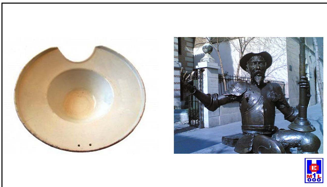
Foto 8 Bacía. Don Quijote de la Mancha con la bacía puesta sobre su cabeza

Se llamaba bacía a la vasija cóncava y grande, de metal o de barro, ancha, redonda u ovalada y, por lo general, con una escotadura semicircular en el borde (para encajarse en el cuello del cliente). El uso más común lo tenía en las barberías, como recipiente de la espuma para humedecer y jabonar la barba y para sangrías. (Del latín medieval bacia ). Real Academia de la Lengua Española.